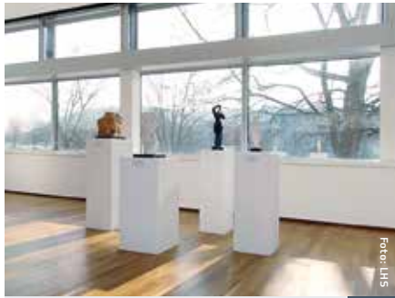
Saarländisches Landesmuseum 4