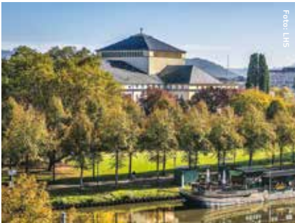
Saarer, Staatstheater 2