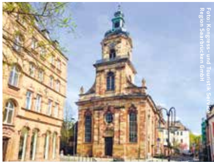
Basilika St. Johann 3